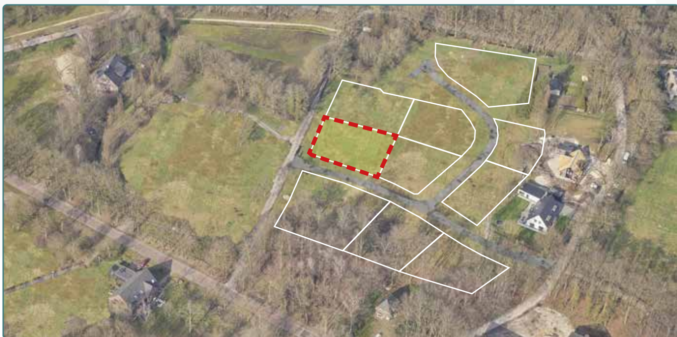
Kavel 166 vanuit de lucht